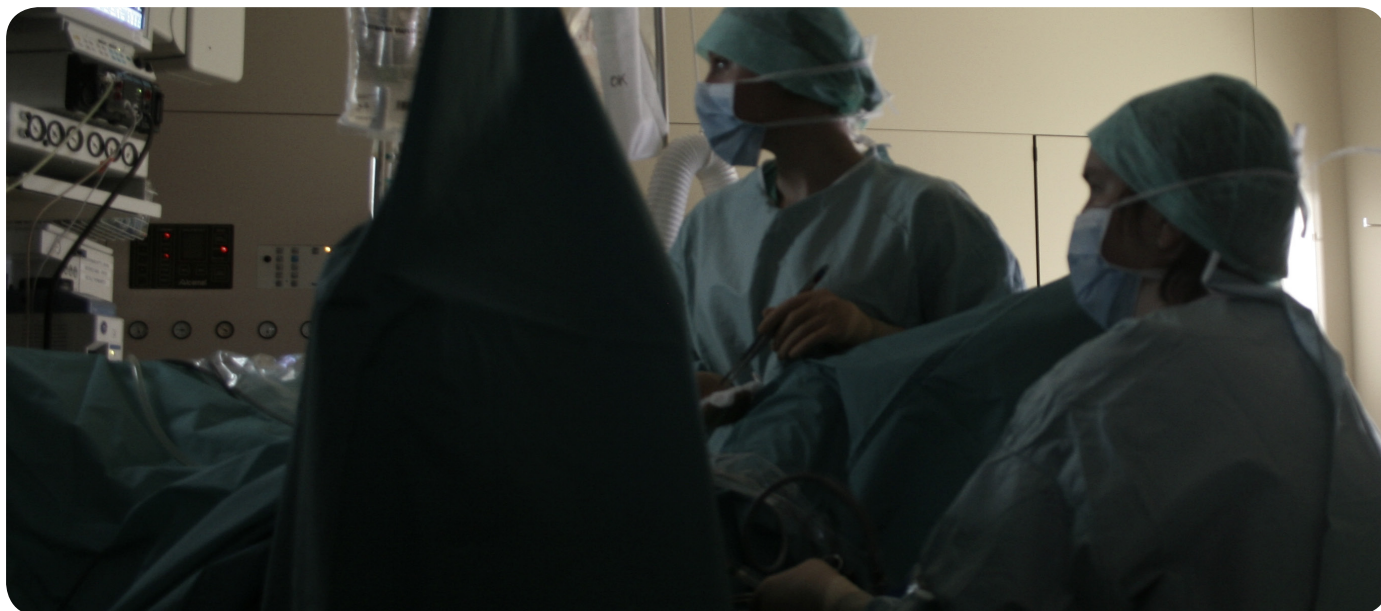
• Moment tijdens een operatie.

E r zijn verschillende ingrepen mogelijk, de een ingrijpender dan de ander.